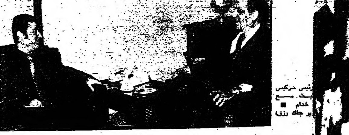
رئيس مريض يخدم يرجك رزق

قدم الوفد السوري بوفده زيارته الى لبنان في الساعة السابعة من مساء أمس عن طريق البر الى القصر الجمهوري في بيروت. السيد عبد الحليم خدام نائب رئيس الوزراء ووزير الخارجية يرافقه اللواء ناهي جميل نائب وزير الدفاع، واللواء حكمت الشهابي رئيس اركان الجيش السوري، وعلى الفور عقدت الجولة الأولى من المحادثات برئاسة الرئيس السيد نزار بريس، ووزير الخارجية السيد نزار بريس الذي كان قد وصل الى القصر في الخامسة من بعد ظهر امس.